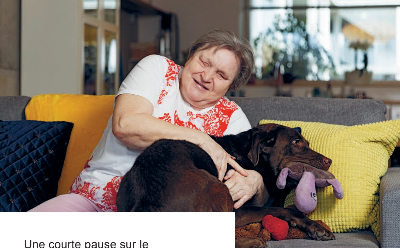
Une courte pause sur le canapé pour la robuste retraitée.

ses enfants, devenus adultes, et pour son petit-fils, qui est bientôt majeur. Et elle continue à suivre des formations. Souvent frustrée par l'attitude peu inclusive de la société face à son handicap visuel, elle apprécie d'autant plus l'offre de la FSA: «On y est au milieu de personnes qui nous comprennent. Dans ces cours, ce n'est pas le handicap qui est au premier plan, mais l'être humain.» Outre la cuisine, elle a deux autres hobbies: la poterie et les voyages. Chaque année, elle participe à un ou deux voyages organisés par des agences spécialisées dans les vacances pour personnes aveugles et malvoyantes.