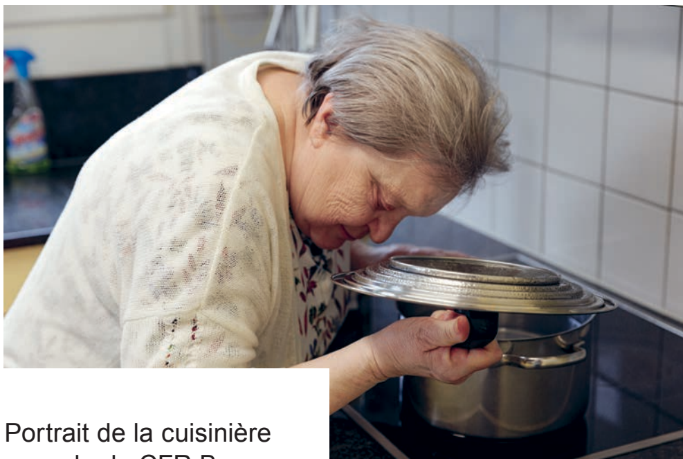
Portrait de la cuisinière aveugle du CFR Berne Page 19