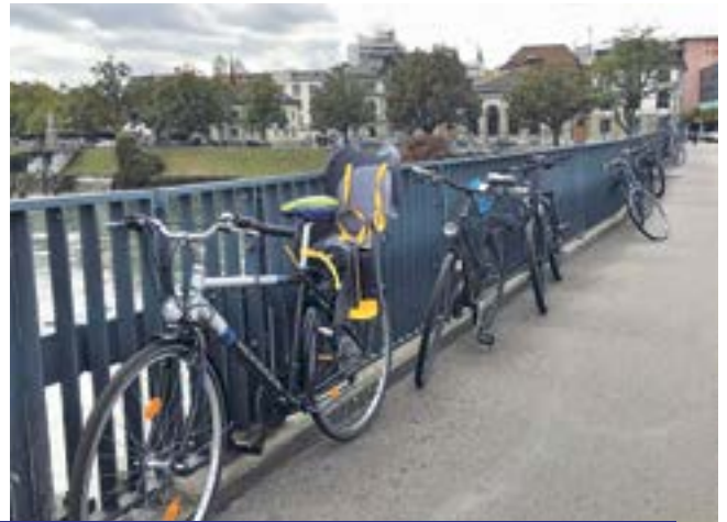
Stationnement sauvage de vélos sur la passerelle de la gare d'Olten.

Le modèle des défenses régionales des intérêts introduit récemment par la FSA auprès des sections a fait ses preuves et engrange les succès. En voici un exemple qui illustre le travail pragmatique et ciblé fournit quotidiennement et qui symbolise l'engagement conséquent de toutes les défenses régionales des intérêts de la FSA. Les membres de la FSA de la région d'Olten commençaient à redouter de devoir emprunter la passerelle de la gare, qui permet de passer de la gare au centre-ville en traversant l'Aar. La raison? Au fil des années, il était devenu habituel pour les cyclistes de considérer la passerelle comme une place de stationnement et d'utiliser les rambardes pour y attacher leurs vélos. Les personnes aveugles et malvoyantes ne pouvaient au final plus s'orienter correctement. La Défense des intérêts de la section Argovie-Soleure a repéré le danger et s'est adressée au service municipal compétent. La réaction n'a pas tardé. Désormais, des affiches et panneaux indicateurs signalent la possible infraction. En outre, des vélos toujours stationnés sur le pont ont été retirés par la police après un bref délai transitoire. Les personnes intéressées obtiennent désormais des nouvelles de l'engagement et des résultats de la défense des intérêts centrale et de celle de nos régions grâce au fil d'actualité mensuel, avec chaque fois un exemple précis.