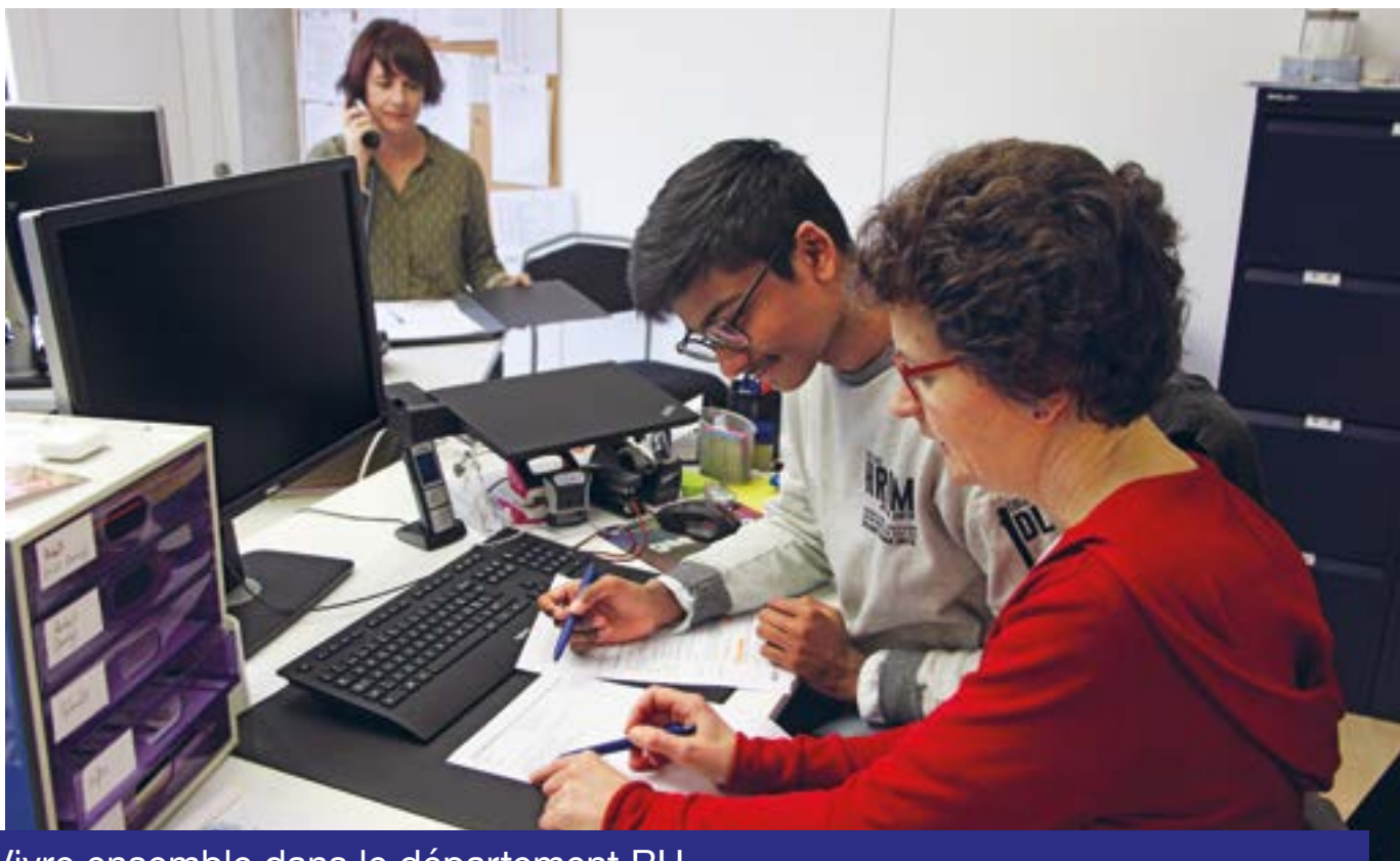
Vivre ensemble dans le département RH.

appropriés. Les collaborateurs aveugles ou malvoyants sont une source d'enrichissement pour une équipe. Et avantage collatéral: leurs chiens-guides favorisent la bonne ambiance.