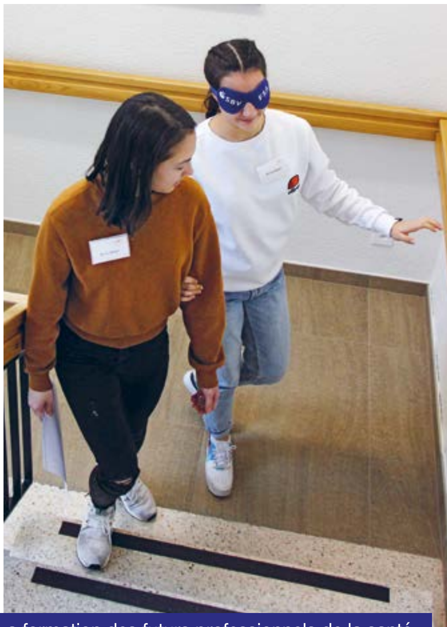
La formation des futurs professionnels de la santé.

de prestations payantes et à une offre de perfectionnement adaptée aux possibi-