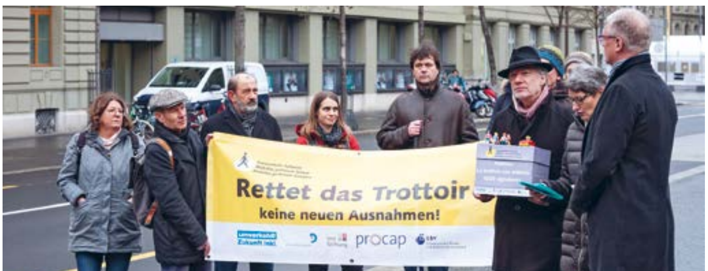
Collaboration avec Mobilité piétonne Suisse pour la pétition «Sauvez le trottoir» soutenue par la FSA et remise en début d'année.

Un contact permanent a pu être établi entre la Défense des intérêts FSA et le