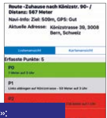
App GPS «MyWay»: Capture d'écran (en allemand).

La mise à jour de cette application développée par la FSA (voir aussi page 27) propose non seulement une nouvelle implémentation technologique, mais aussi diverses nouvelles fonctions telles que la navigation vers une adresse enregistrée ou quelconque, l'enregistrement d'itinéraires sous forme de favoris, la recherche et le tri d'itinéraires selon les filtres choisis ainsi que l'affichage de points d'intérêts et de correspondances de transports publics. Autre nouvelle fonction: l'affichage de la position actuelle comprenant la possibilité de la partager avec d'autres personnes par SMS ou par e-mail. Cette dernière possibi-