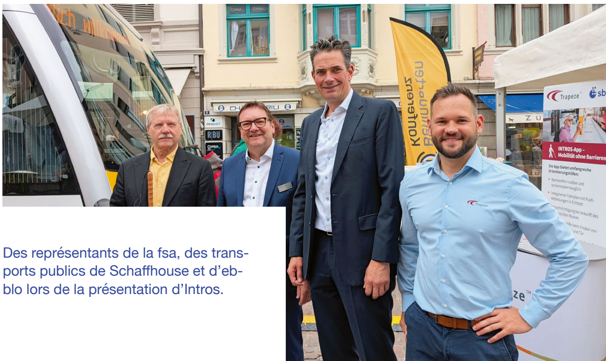
Des représentants de la fsa, des transports publics de Schaffhouse et d'ebblo lors de la présentation d'Intros.

Par ailleurs, la fsa conseille des spécialistes et des entreprises en matière d'accessibilité numérique. L'offre comprend des tests de produits, des ateliers avec des démonstrations en direct et des conseils sur mesure.