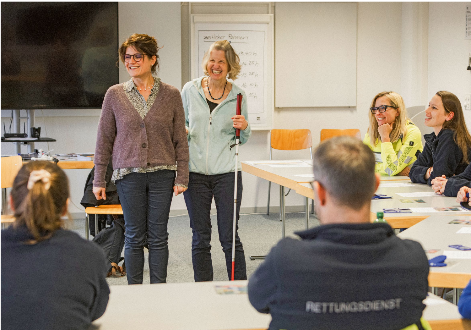
La fsa sensibilise divers groupes professionnels à la prise en charge des personnes malvoyantes.

La réunion en présentiel a également été mise à profit pour poursuivre la révision de la liste de contrôle pour les établissements médico-sociaux.